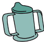
Beker met drinktuit