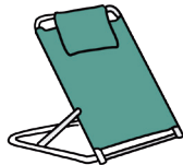
Ruggensteun (om te kunnen zitten in bed)