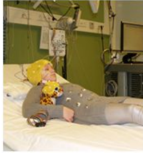
en ogen dicht