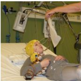
De zakdoek wegblazen