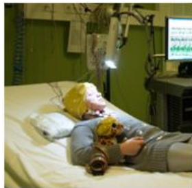
In de knipperlamp kijken

Na ongeveer een half uur zegt de laborant dat het klaar is. Je moet nog even blijven liggen zodat we alle draadjes en de muts er af kunnen halen. Er zit nu nog wat gel in je haren. De laborant zal het een beetje van je hoofd poetsen. Als je thuis je haren was, is alles er zo weer uit.