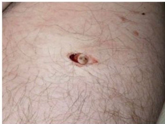
Een gaatje in de huid geboord