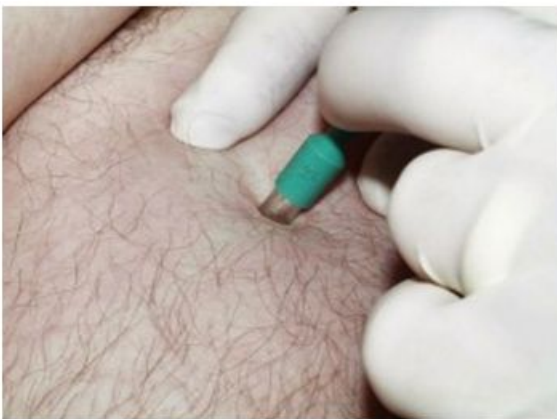
Uitstansen, ronddraaiende beweging