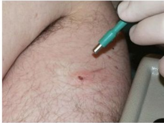
4 mm biopteur (punch)